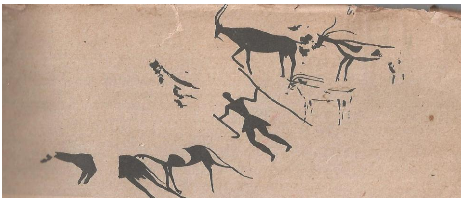
Peinture rupestre (Tassili des Ajjer, oued Djebar).

Autre élément nouveau : on trouve les lamelles taillées, très loin de tous les centres d'extraction naturelle du silex, ce qui suppose des migrations donc un stade d'évolution plus poussé des sociétés. On sait faire désormais des lamelles fines, des grattoirs, des rabots.